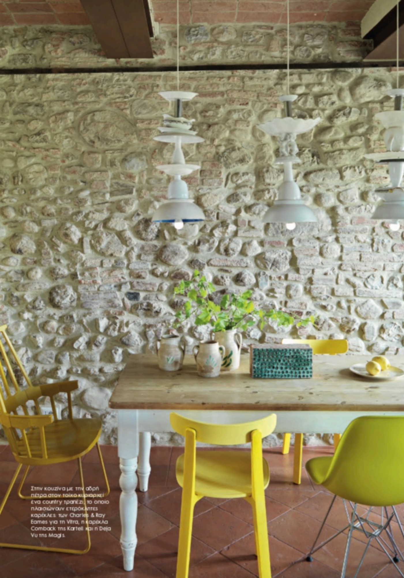
Στην κουζίνα με την αδρή πέτρα στον τοίχο κυριαρχεί ένα country τραπέζι, το οποίο ηλαιοχρωμάειν ετερόκλητες καρέκλες των Charles & Ray Eames για τη Vitra, η καρέκλα Comback της Kartell και η Deja Vu της Magis.