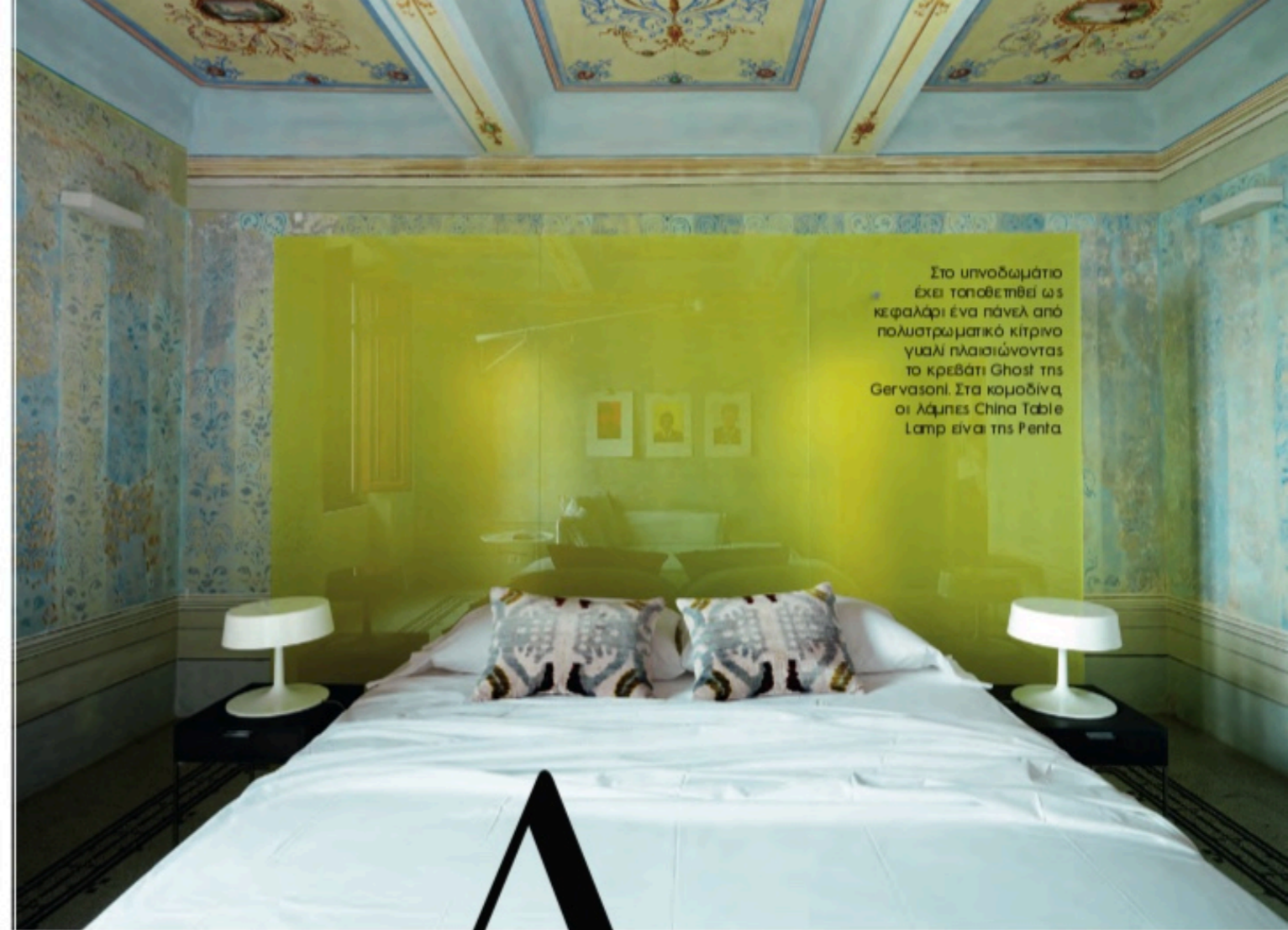
Στο υπνοδωμάτιο έχει τοποθετηθεί ως κεφαλάρι ένα πάνελ από πολυστρωματικό κίτρινο γυαλί πλαισιώνοντας το κρεβάτι Ghost της Gervasoni. Στα κομοδίνα οι λάμπες China Table Lamp είναι της Penta.